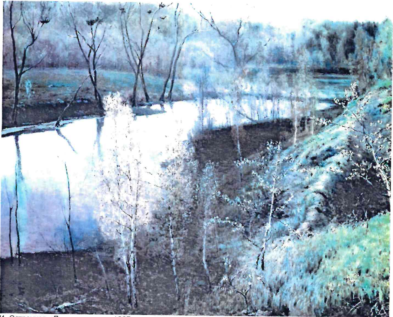
И. Остроухов «Первая зелень» 1887